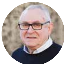
Serge Badens PYRAMIDE-FORÊT